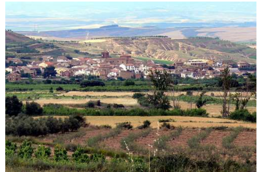
Vista de Corera

Excmo. Ayuntamiento de Corera La Iglesia, 14 26144 CORERA (La Rioja) Tfno. Y Fax 941438009 Email: ayuntamiento@aytocorera.org