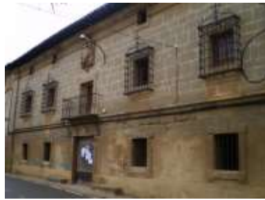
Casa Marques de Vargas