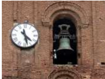
Campanario y Reloj Iglesia