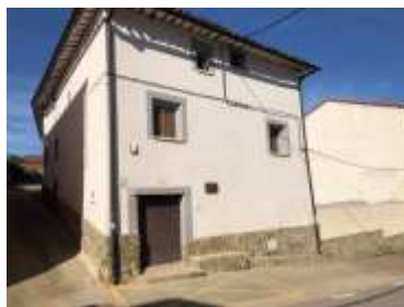
La Casa del Espartero