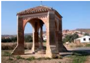
Crucero o Crucifijo