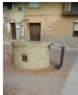
Pozo Marqués de Vargas