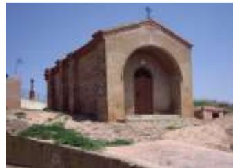
Ermita Santa Barbara