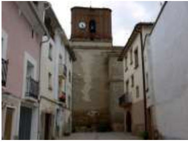
Ayuntamiento e Iglesia